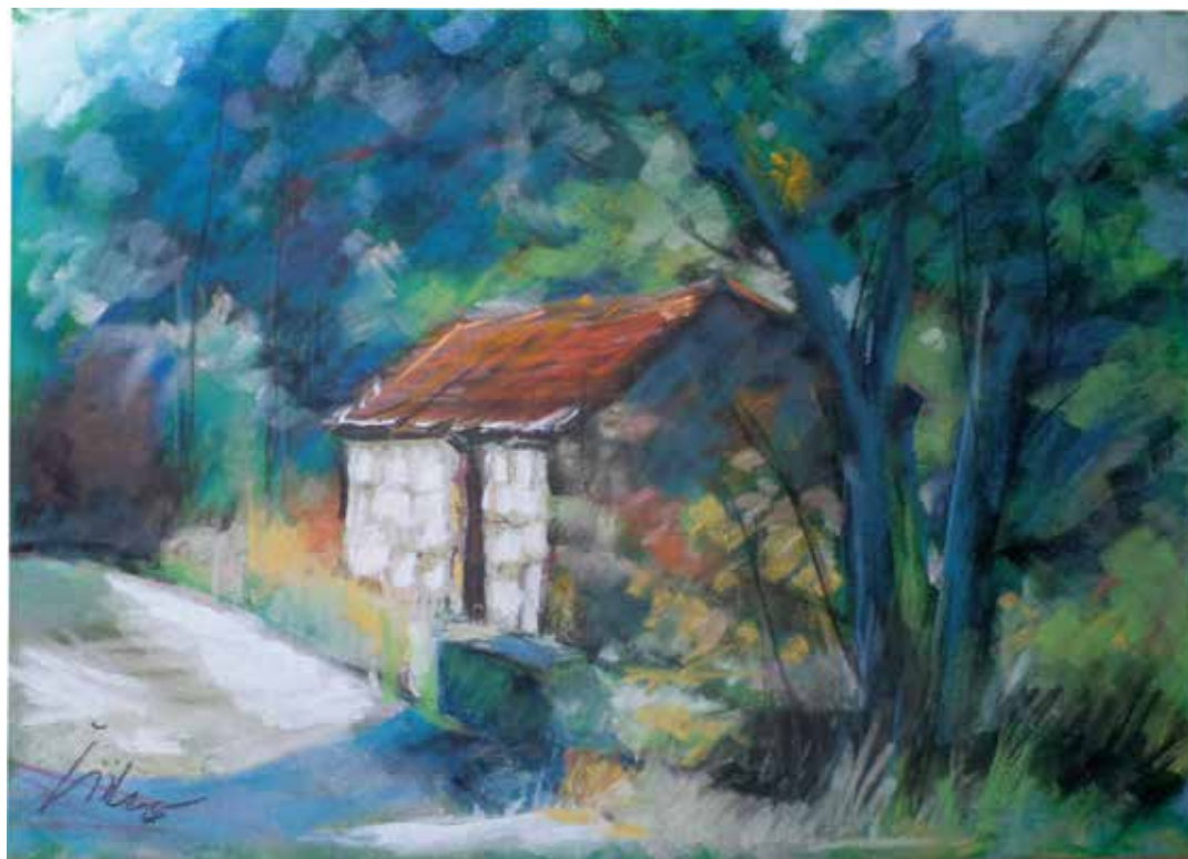
U dalmatinskoj Zagori, suhi pastel, 2015.