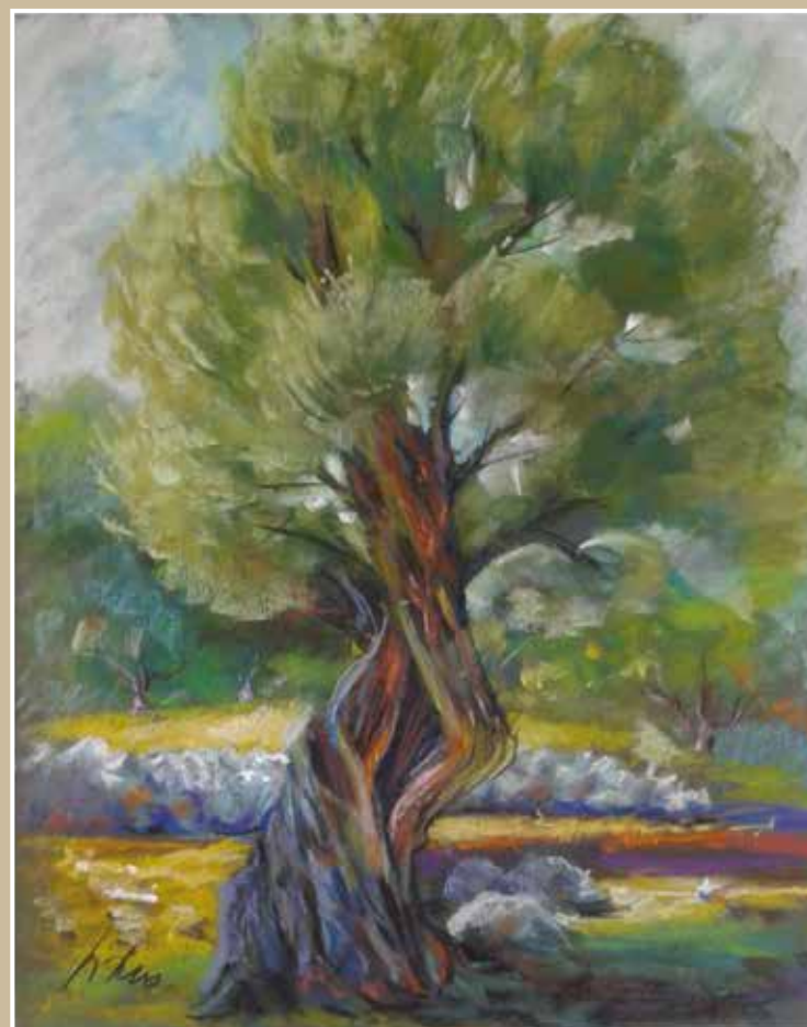
Stara maslina, suhi pastel, 2016.

GRADSKA GALERIJA ANTUN GOJAK MAKARSKA 30. 9. - 7. 10. 2016.