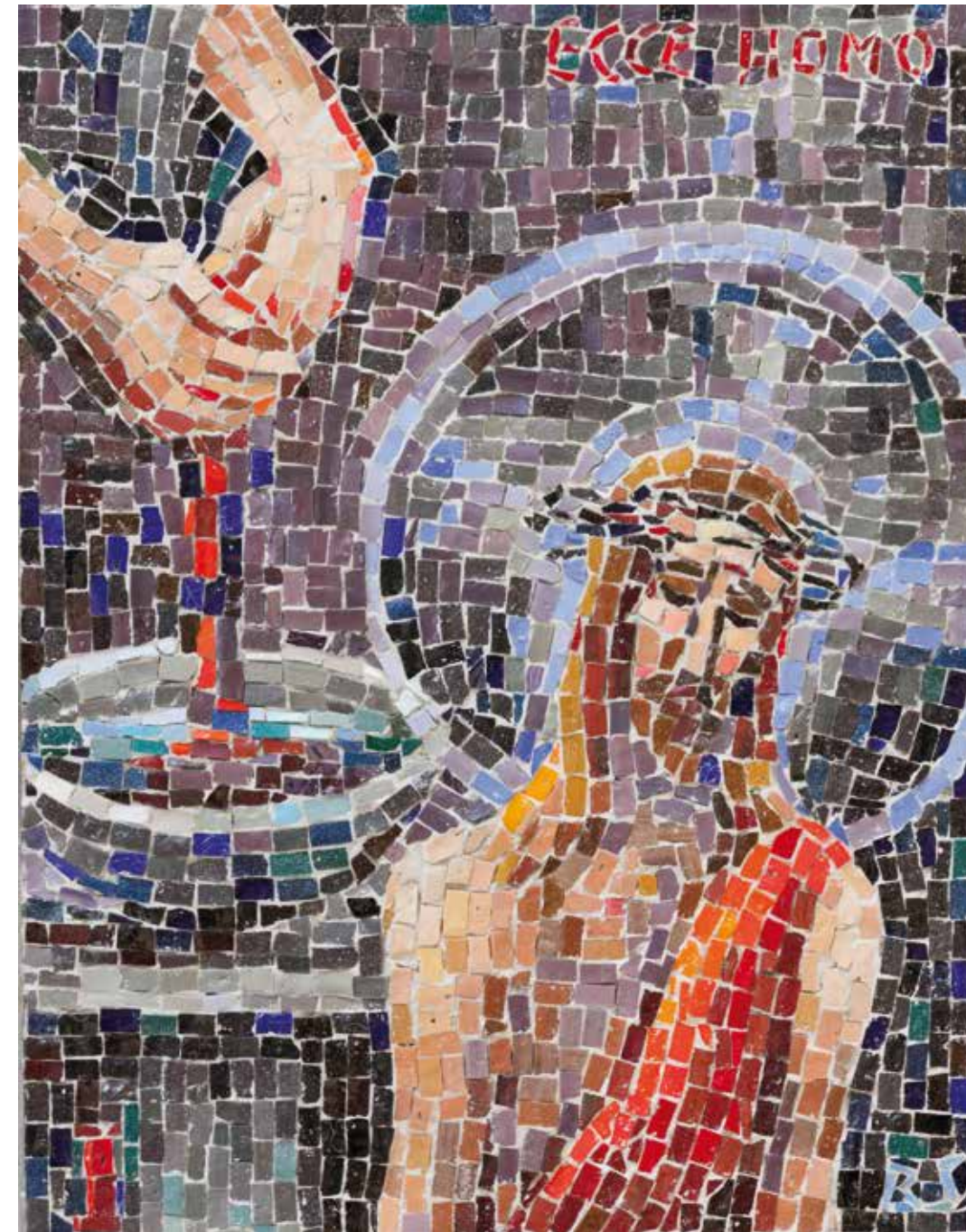
Evo čovjeka!, 2016. (kat.br. 13)