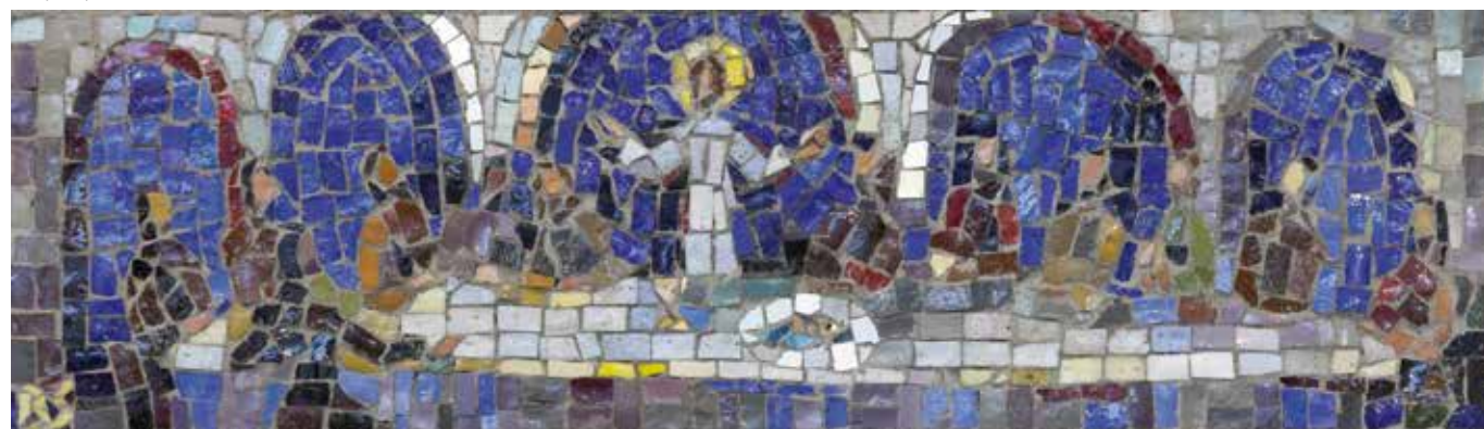
Posljednja večera, 2016. (kat.br. 28)