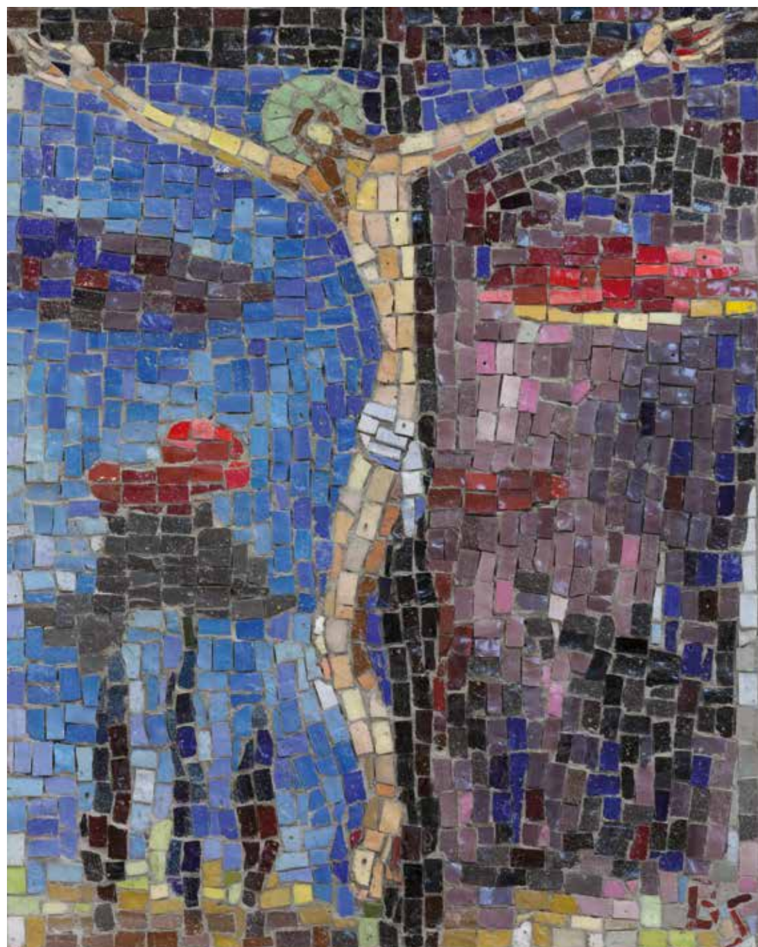
Raspeće u suton, 2015. (kat.br. 11)