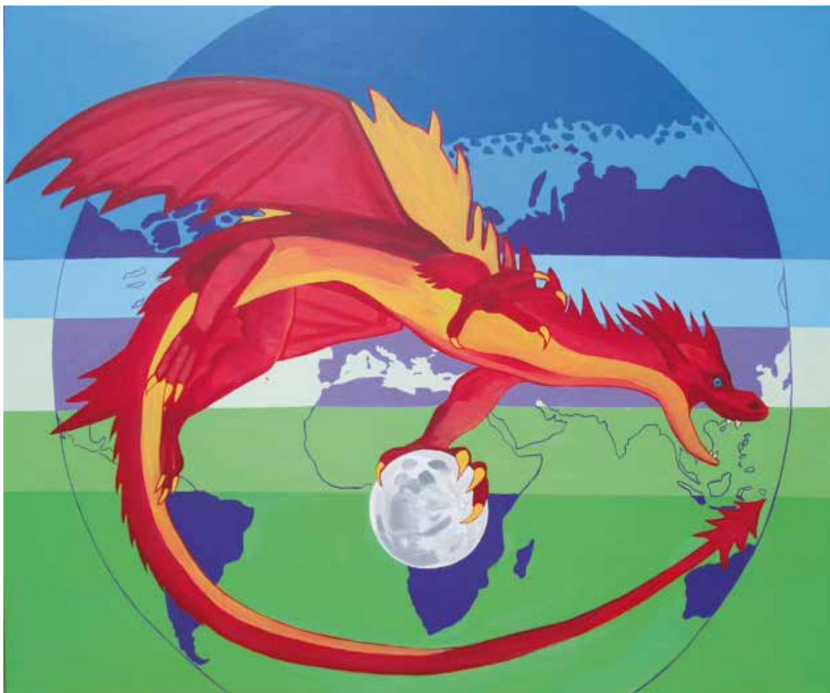
Zmaj Kandža "the keeper of Earth" (kat. br. 10.)