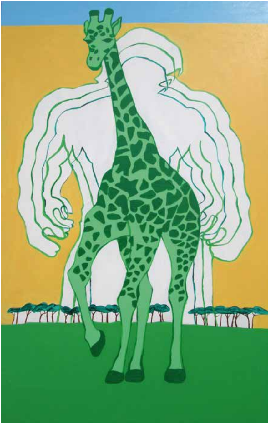
Hulka (kat. br. 1.)