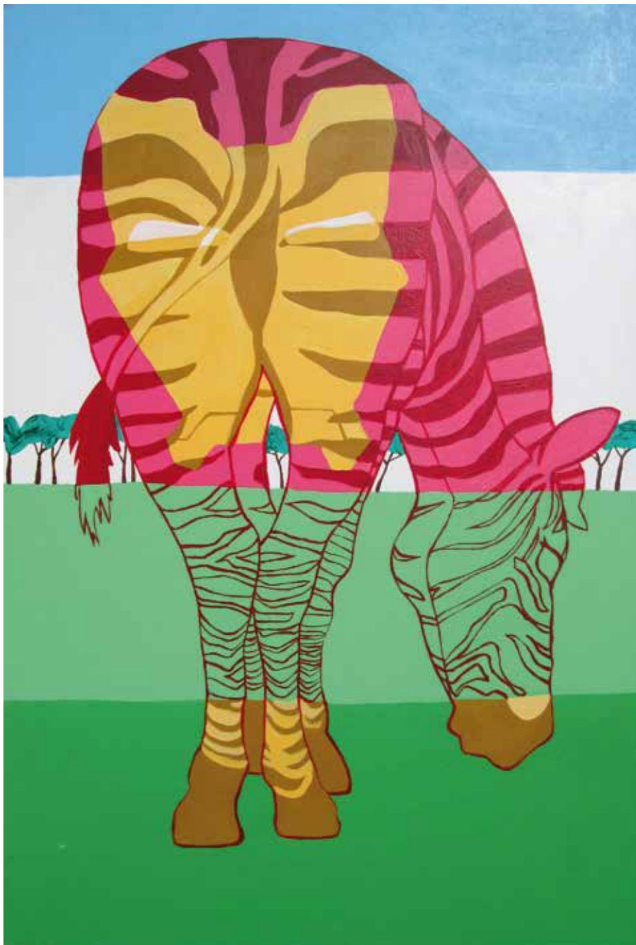
IroZebman (kat. br. 2.)