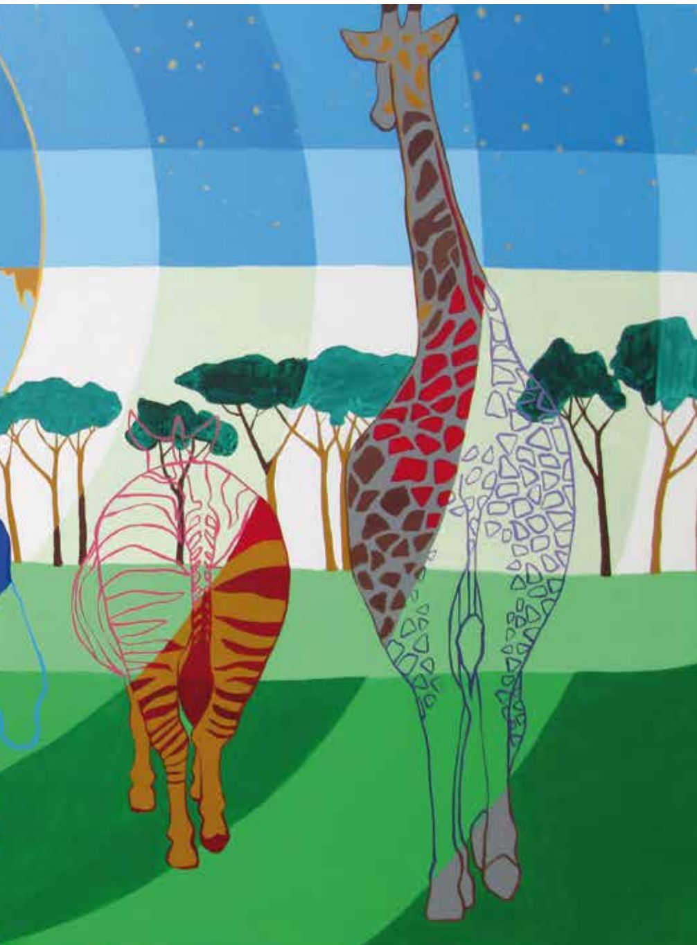
Marvelouass (veliĉanstvene guzice) (kat. br. 6.)