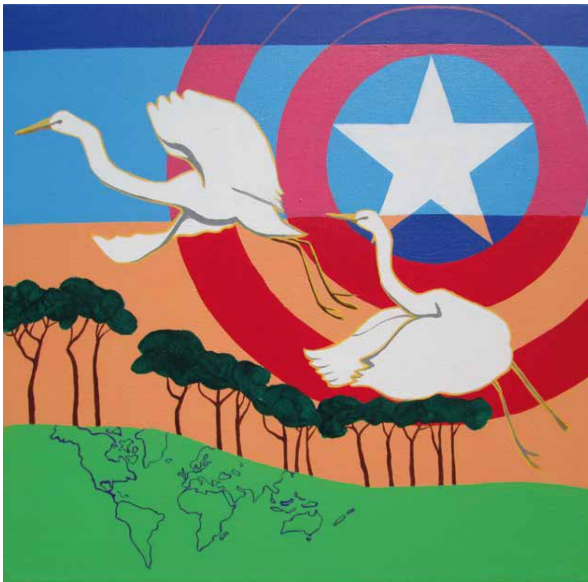
Marvelinke (kat. br. 3.)