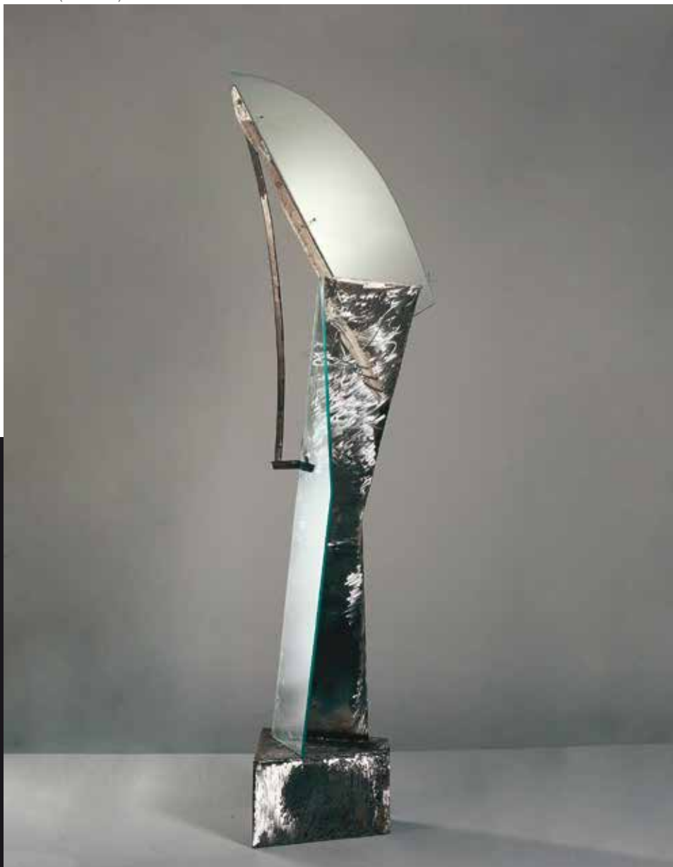
Brevitas (kat. br. 2)