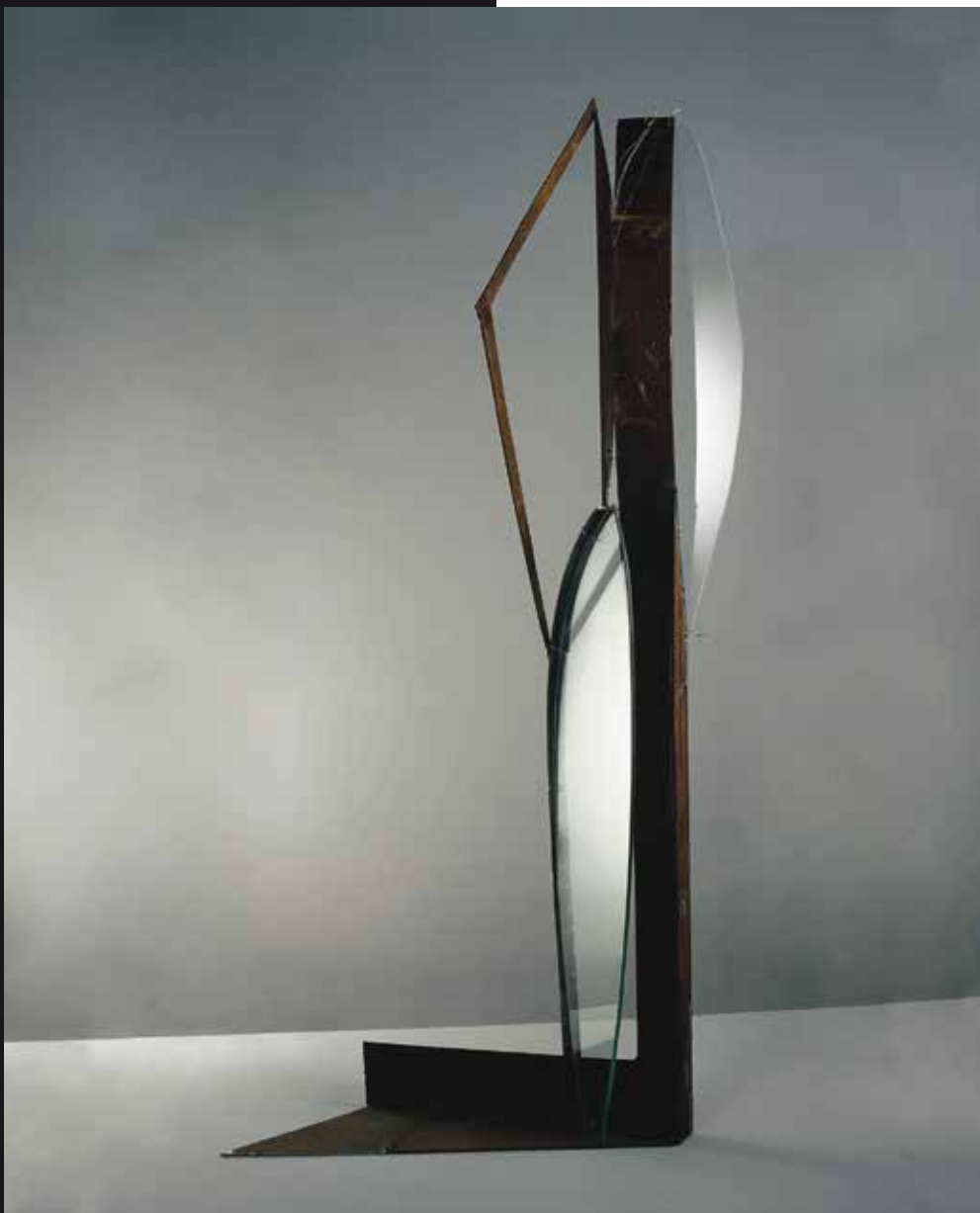
Apokopa (kat. br. 3)