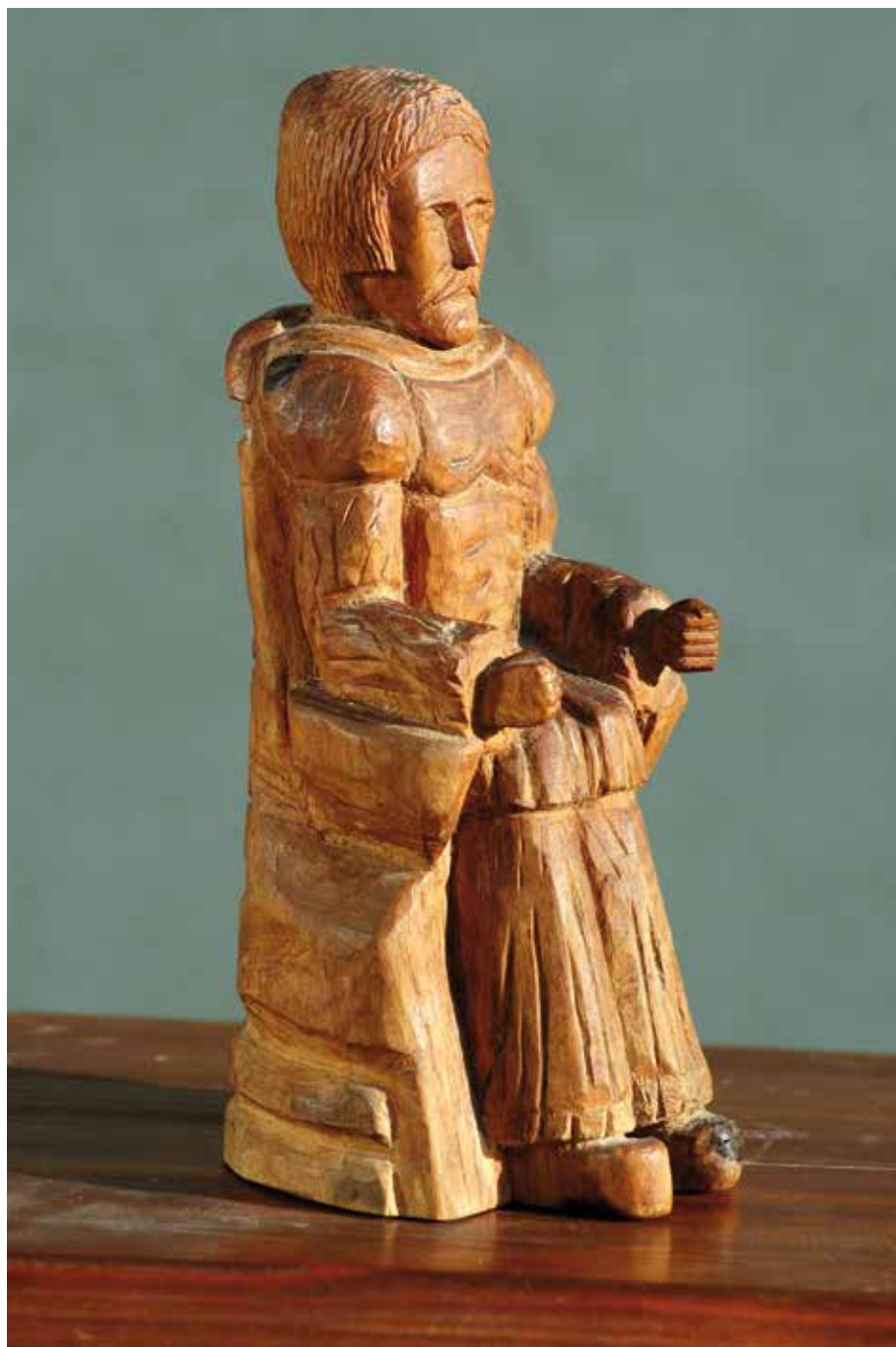
Vladar 1974. (kat.br. 4.)