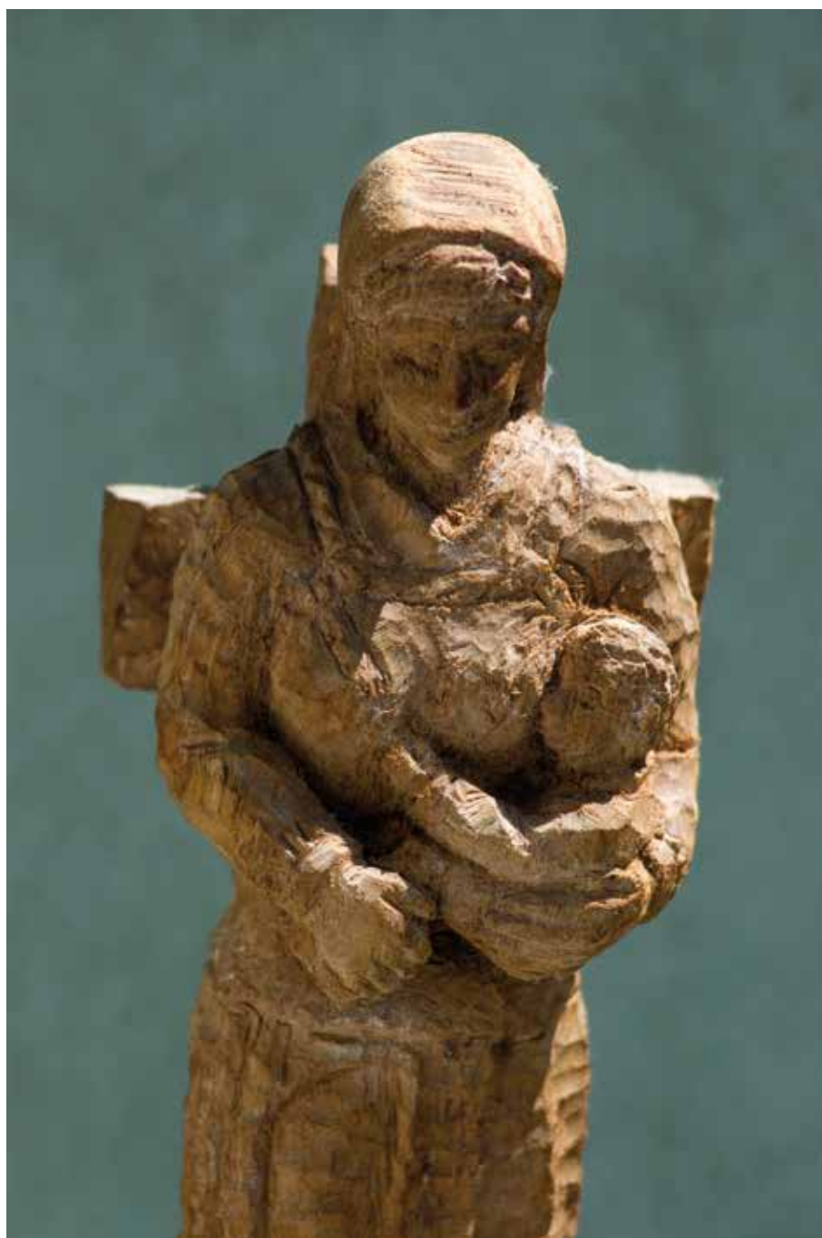
Breme života 2010. (kat.br. 10.)