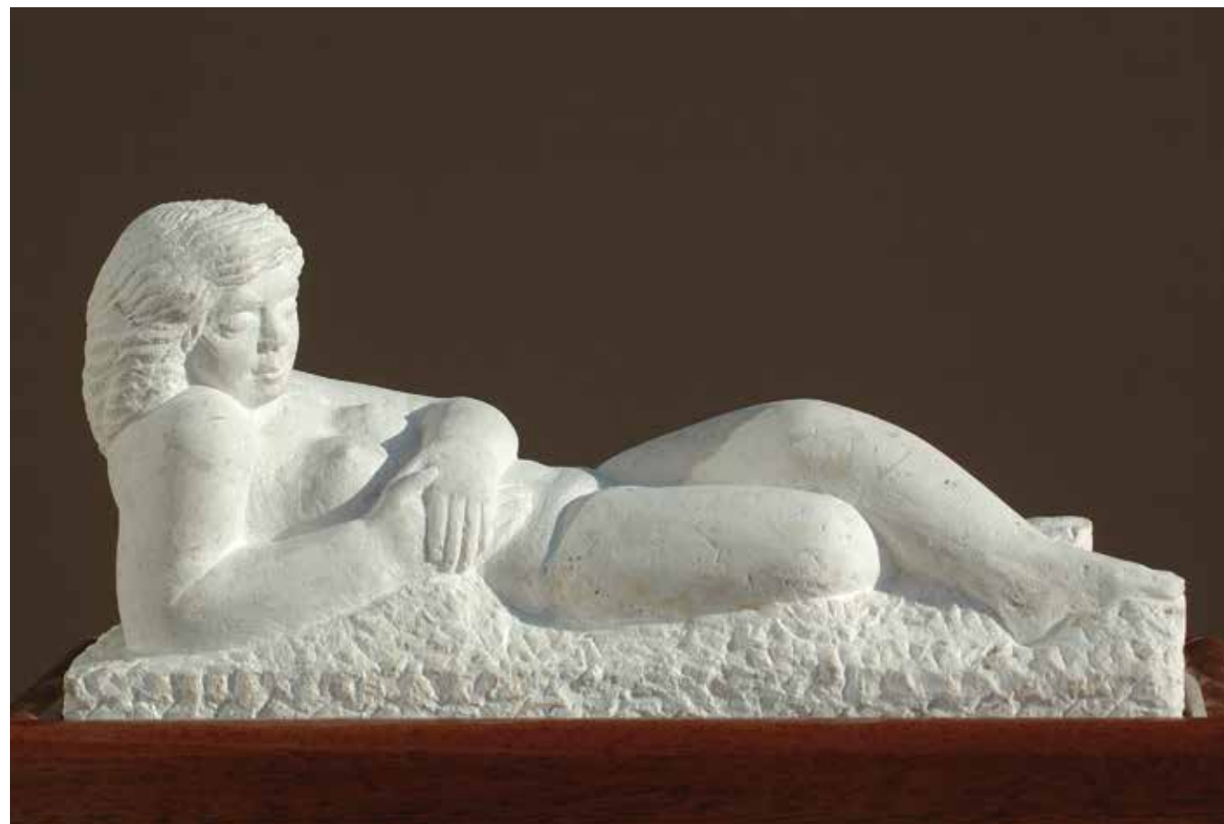
Opuštanje , 2012. (kat.br. 16.)