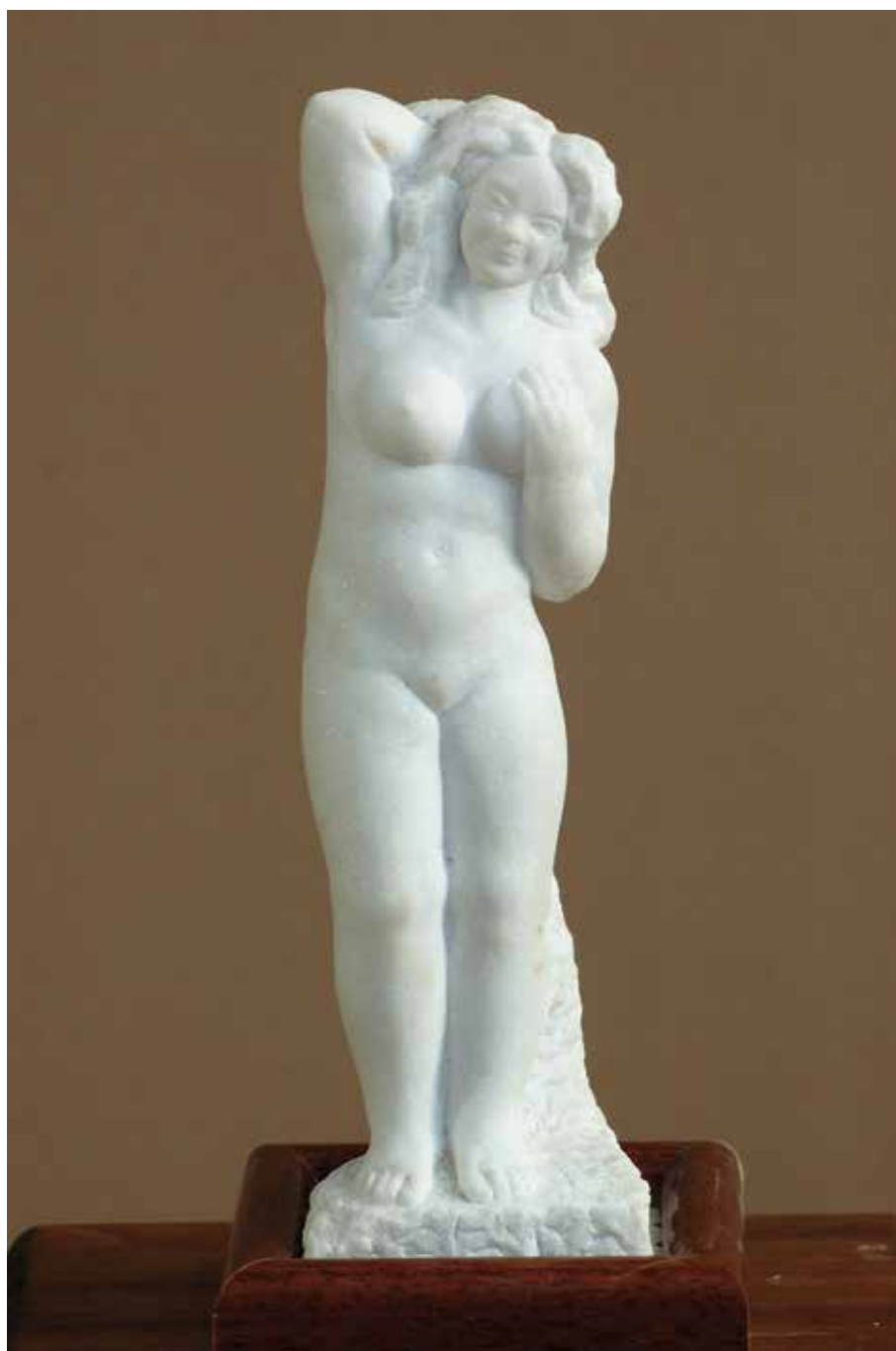
Vesela 2001. (kat.br. 7.)