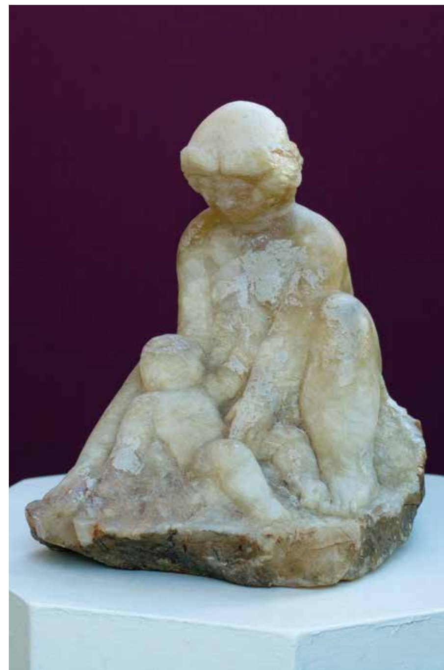
Igra majke i djeteta, 2010. (kat.br. 13.)