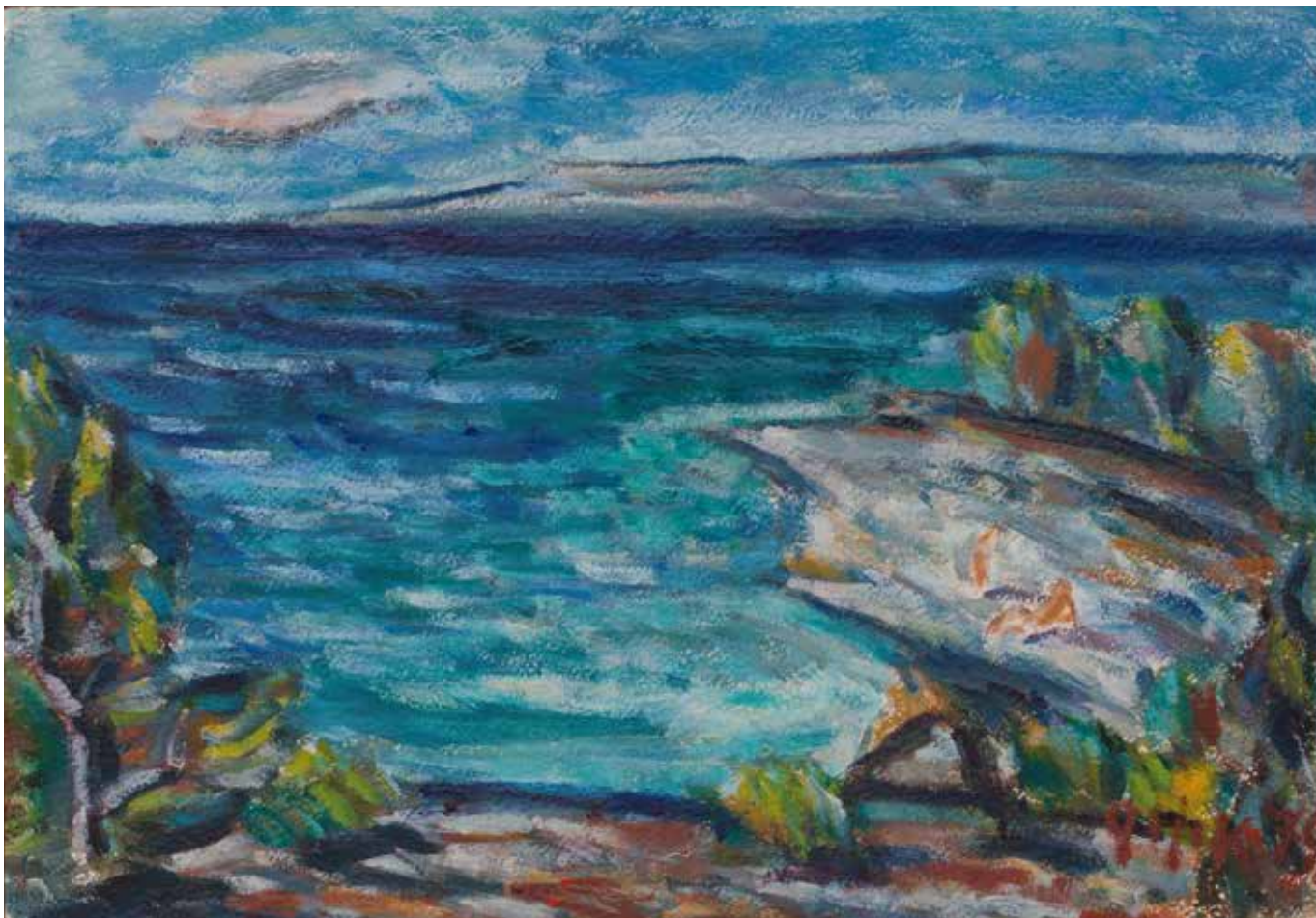
Majski burni dan, 1979. (kat. br. 22.)