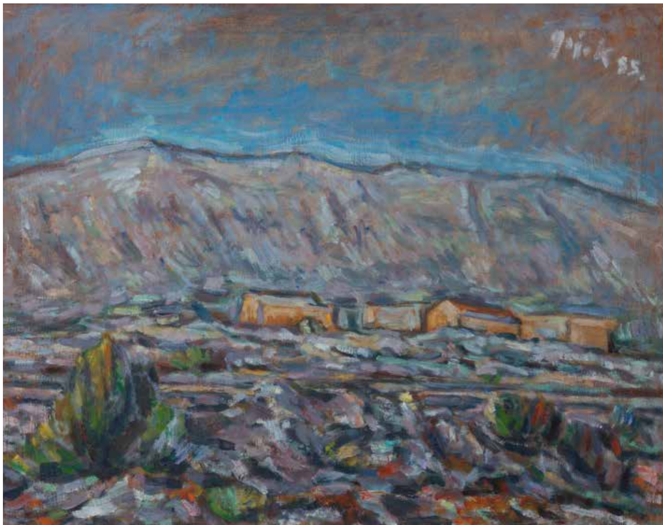
Kamenjar u Zavojanima, 1985. (kat. br. 19.)