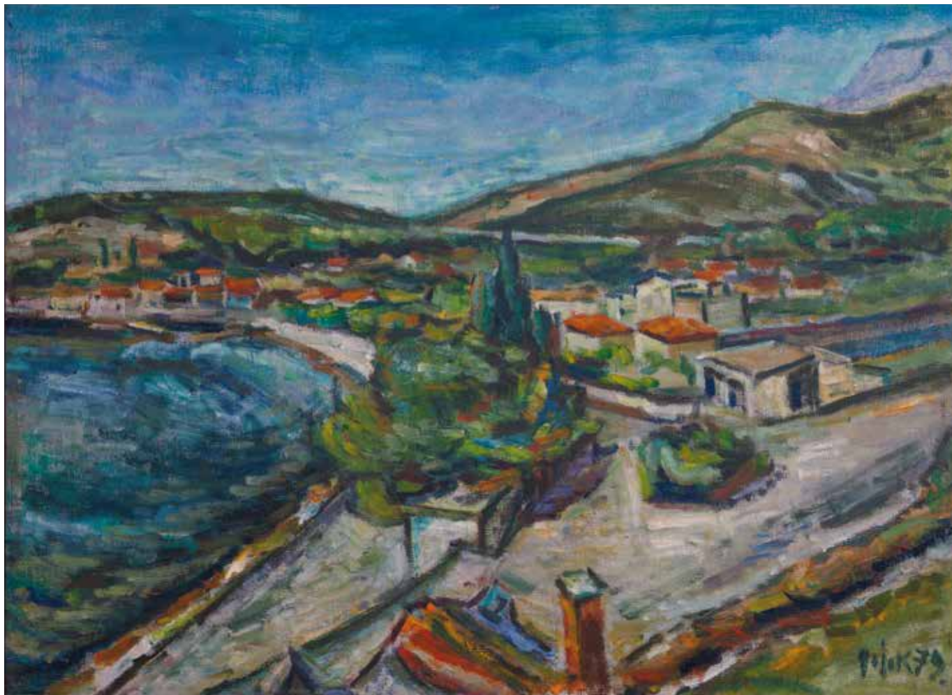
Drvenik - Donja Vala, 1979. (kat. br. 16.)