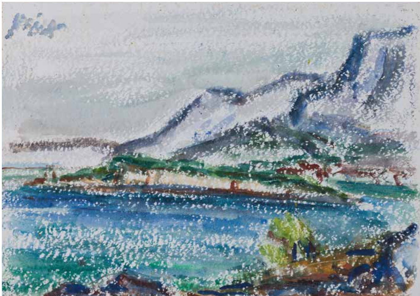
Pogled na Sveti Petar s Osejave, s.a. (kat. br. 11.)