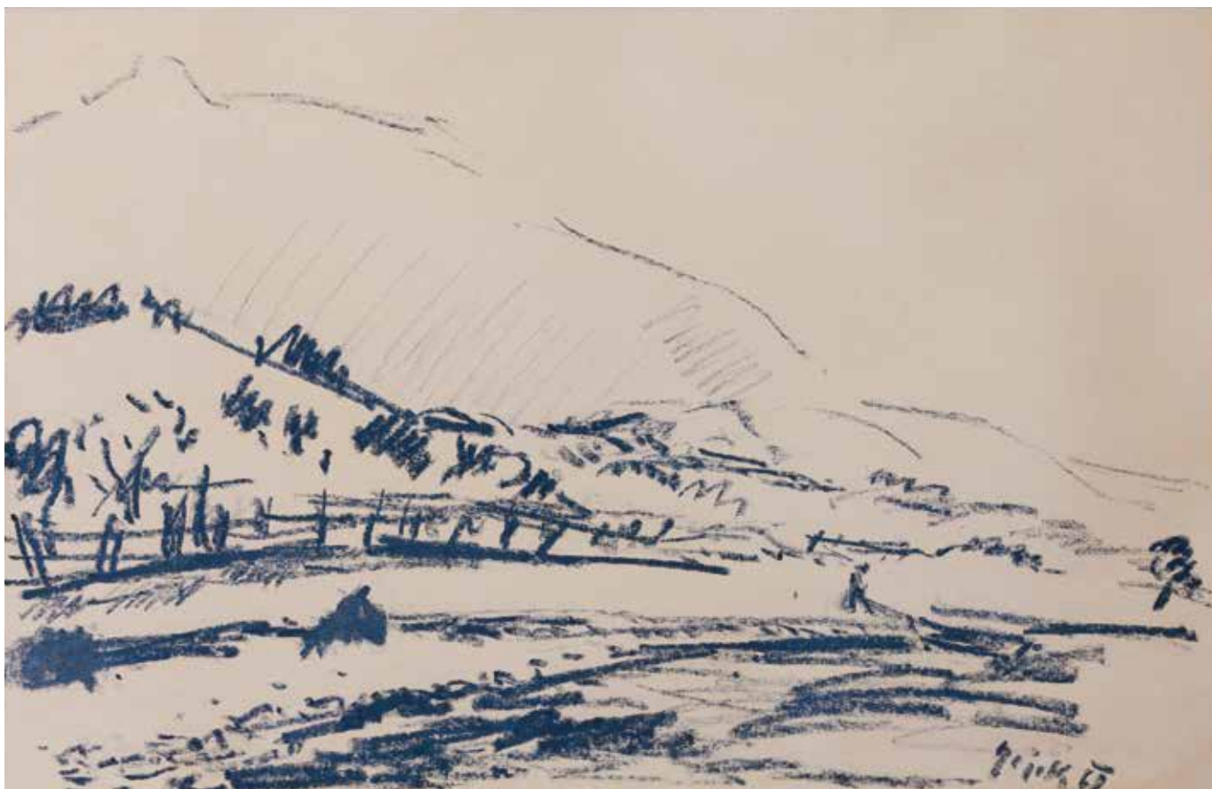
Cvitačka, 1962. (kat. br. 1.)