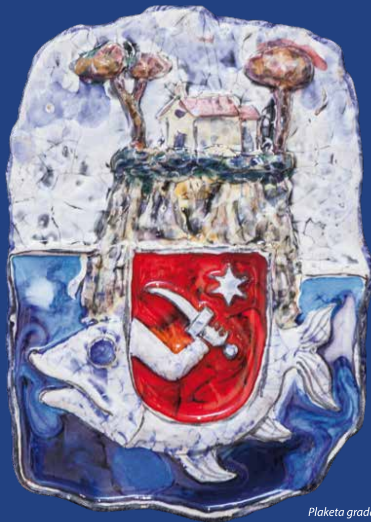
Plaketa grada II (kat.br. 32)