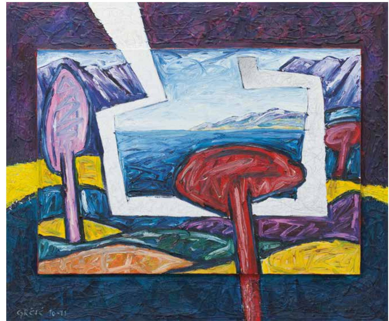
Morski put (kat.br. 12)