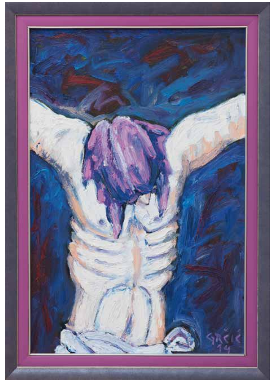
Raspelo (kat.br. 7)