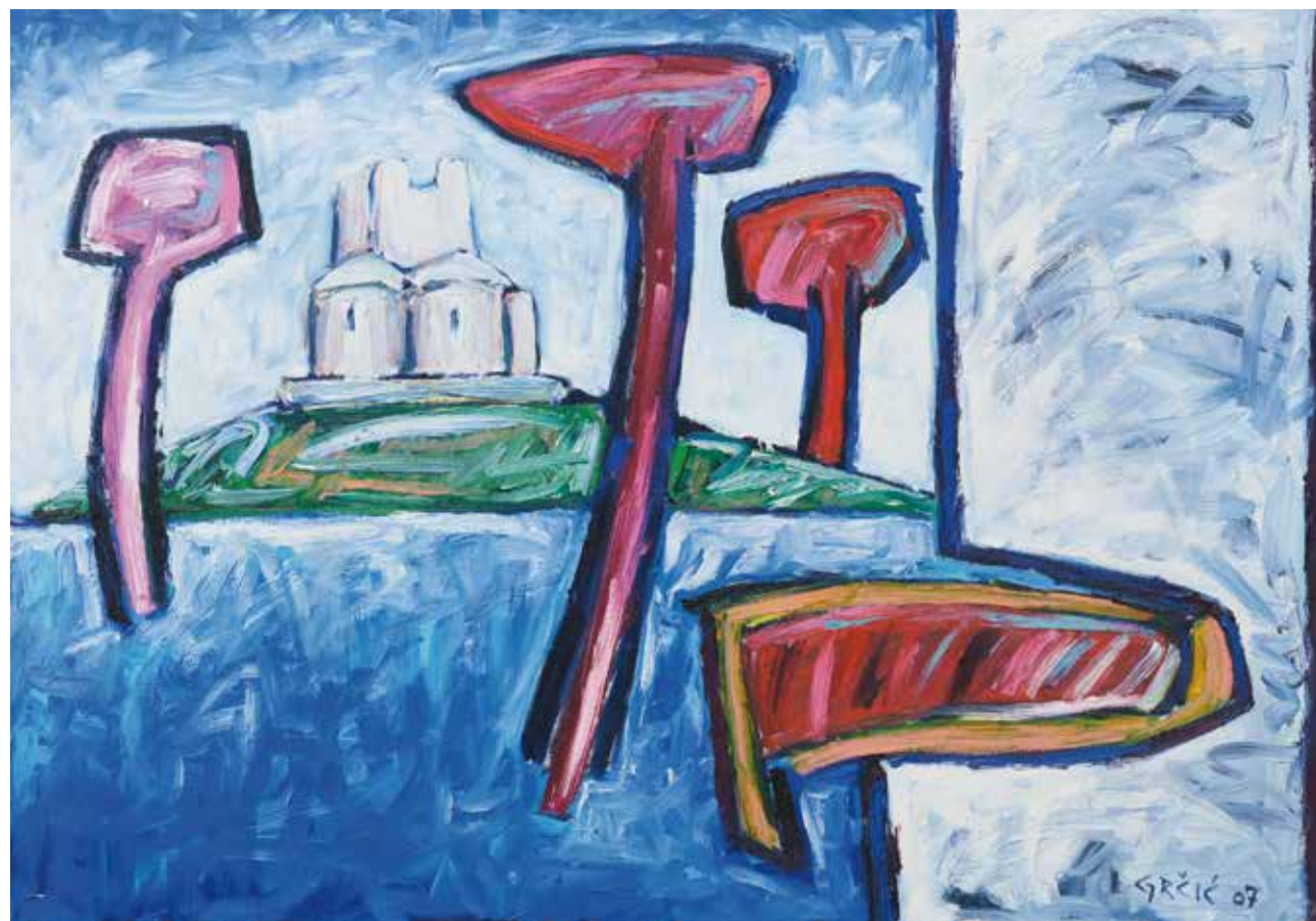
Sv. Nikola, Nin (kat.br. 14)