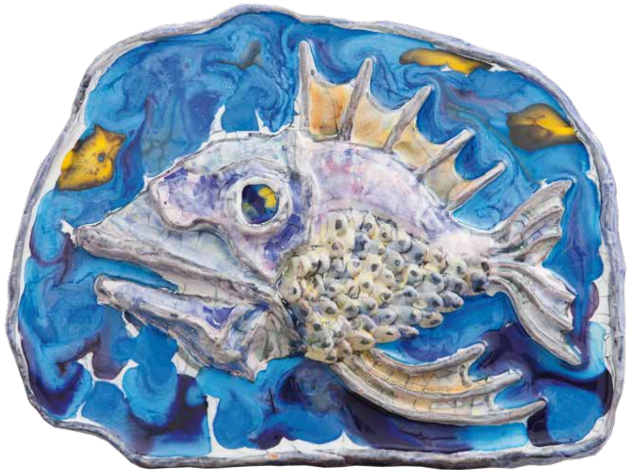
Riba fosil (kat.br. 34)