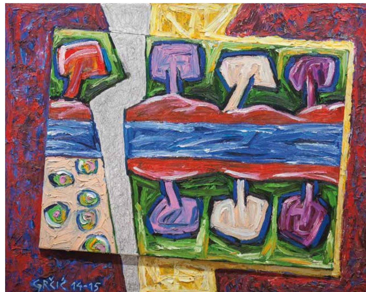
Cetina (kat.br. 10)